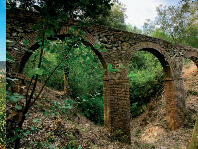
Aqüeducte Gran de Can Vilallonga (Consorci de les Gavarres).

Oficina de Turismo de Sant Antoni de Calonge Av. Catalunya 26 T. 972 661 714 www.calonge-santantoni.com www.calonge.cat turisme@calonge.cat