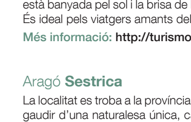
Església de Sant Celoni.