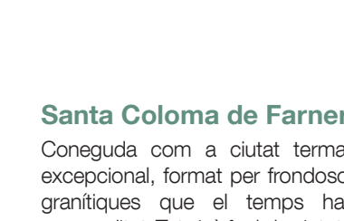
Parc de Sant Salvador, Santa Coloma de Farners.