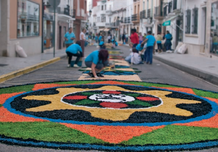
Corpus Christi, San Vicente de Alcántara.

Mancomunidad Sierra de San Pedro C. Pizarro 16, Valencia de Alcántara T. 927 668 147 www.mancomunidadsierrasanpedro.com info@mancomunidadsierrasanpedro.com