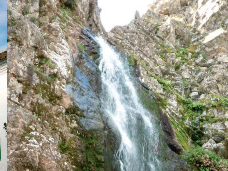
Congost de Carboners, Navahermosa.

Oficina de Turismo d'Hornachuelos Ctra. de San Calixto s/n T. 957 640 786 – 615 646 593 www.hornachuelosrural.com www.hornachuelos.es turismo@hornachuelosrural.com