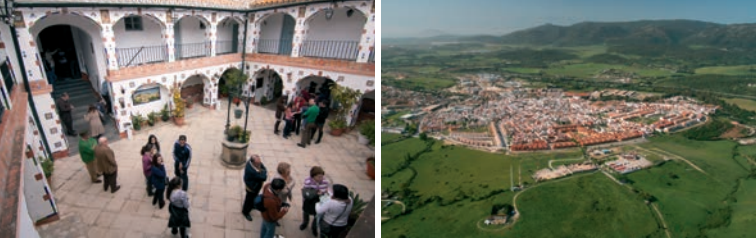
Alcalá de los Gazules.

Punt d'Informació Turística Plaça Joaquín Salgado s/n T. 924 410 945 / 924 410 050 www.turismociudaddelcorcho.es www.sanvicentedealcantara.es