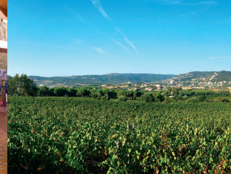
Vinyes a la conca del Tinar.

Ajuntament de Muelas del Pan Plaça Mayor 1 T. 980 553 005 www.ayto-muelasdelpan.com info@ayto-muelasdelpan.com