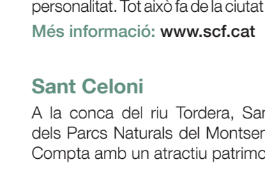
Església de Sant Celoni.