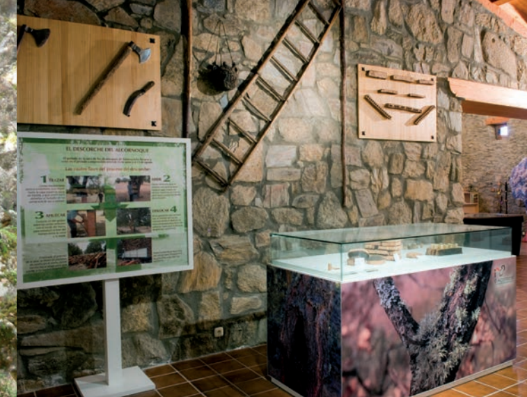
Centre d'Interpretació El Alcornocal.

Ajuntament de Navahermosa Plaça Constitución 1 T. 925 410 111 www.navahermosa.es info@navahermosa.es