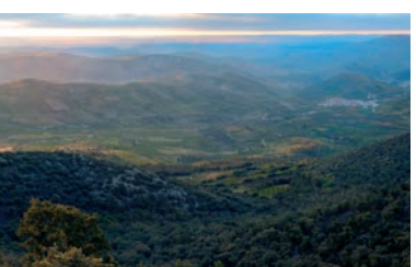
Los Barrios.