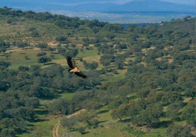
Sierra de San Pedro.

Oficina de Turisme d'Esilda Plaça de l'Ajuntament 1 T. 964 628 000 www.esilda.es esilda_sec@gva.es