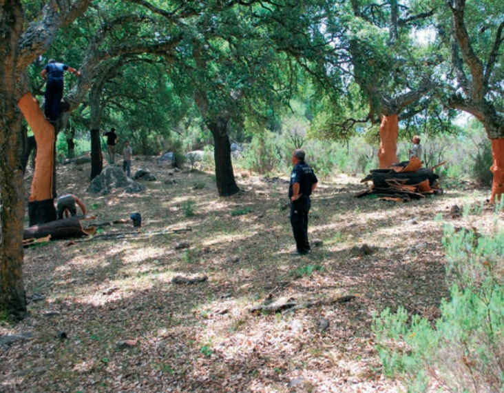
A la sureda es senten les destrals, Cortes de la Frontera.