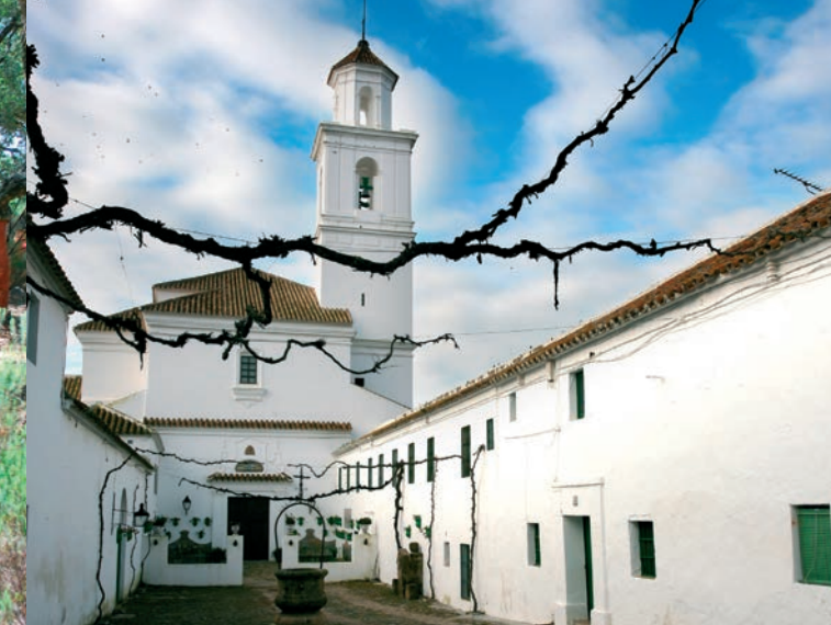
Poblat de San Calixto.

Ajuntament de Cortes de la Frontera Plaça Carlos III s/n T. 952 154 000 www.cortesdelafrontera.es ayuntamiento@cortesdelafrontera.es