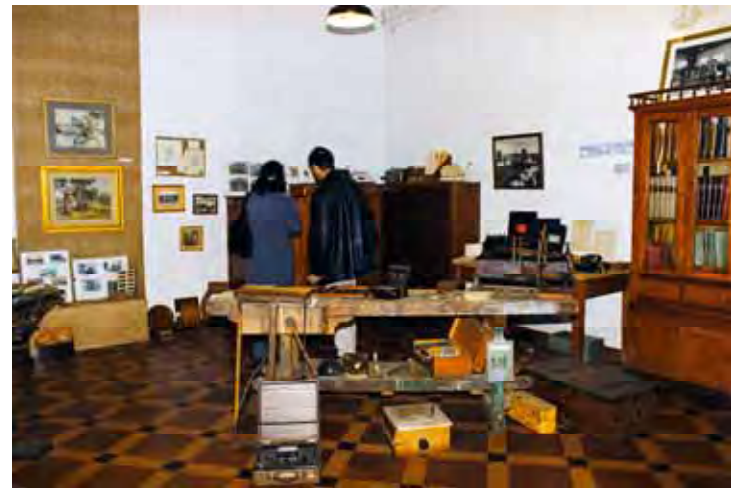
Fábrica Robinson (Portalegre, 2000)