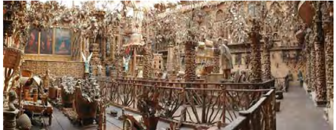
Sala da cortiça MSML